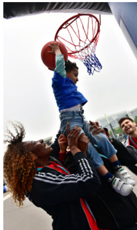
Journée Evasion - Stade de France 2018

Le tout premier objectif est de rendre moins difficile, l'espace de quelques heures, le quotidien d'enfants hospitalisés et/ou en situation de handicap ! C'est aussi de répondre à notre mission de service public et montrer que le basket, comme d'autres sports, peut être utilisé pour rapprocher les gens et provoquer des émotions positives. Aussi, nous souhaitons participer, à hauteur de nos moyens, au rayonnement des actions de Premiers de Cordée. Enfin, c'est de mettre en synergie deux associa-